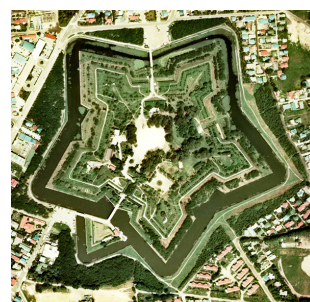
図3 五稜郭の航空写真