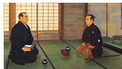
図2 明け渡しの交渉 (左：西郷隆盛／右：勝海舟)