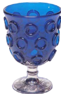
こんるりのつき 図2 紺瑠璃杯