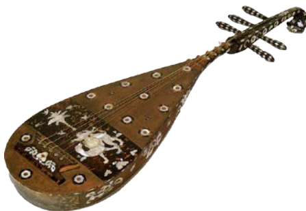
らでんしたんごげんびわ 図1 螺鈿紫檀五絃琵琶

⇒西方文化の香りに満ちることから、正倉院宝庫は「シルクロードの終着駅」とも表現できる。