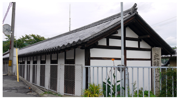
図4 北山十八間戸 (所在地：奈良)

◇(14) …ハンセン病者の救済施設北山十八間戸 きたやまじゅうはちけんど を設置