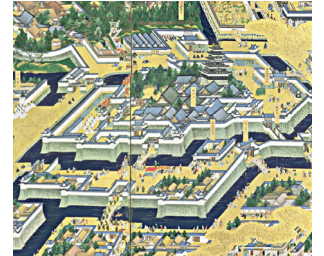
図1 江戸城（江戸時代初期）