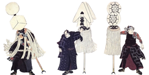
図6 い組・ろ組・は組の纏