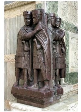
四帝分治制を記念する彫刻