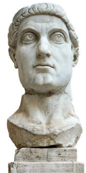
コンスタンティヌス帝