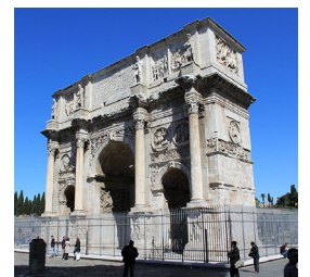
コンスタンティヌス帝の凱旋門